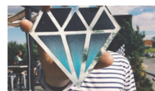
On THE WALL: Le Diamantaire In "Interviews & articles"