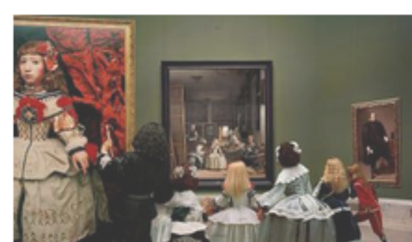
"Las Merinas Renacen de Noche", by Yasumasa Morimura In "New York"